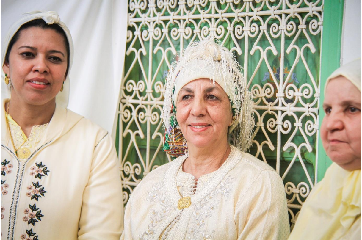
ثلاثة أجيال من نساء مقطرات ماء الزهر