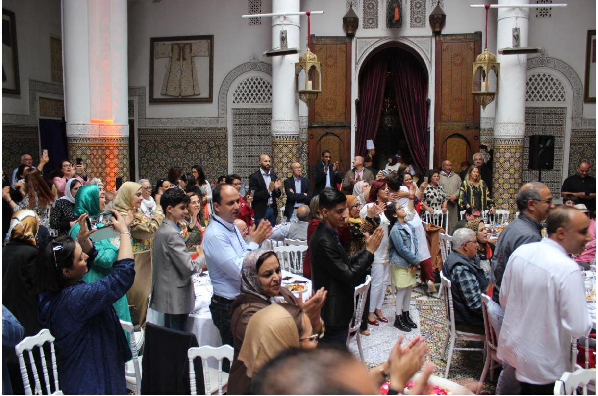
بهجة الإحتفال بزهرية مراکش