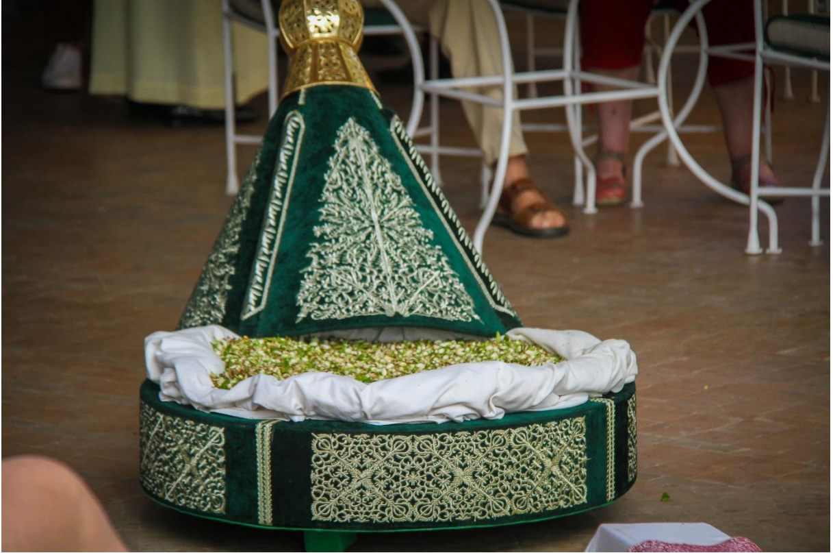
هدية الزهر الفواح