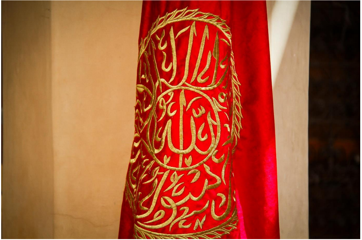
زهريّة مراكش تحت لواء الصلاة على النبي صاحب البهجة والكمال والبهاء والنور