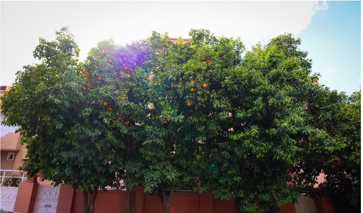
شجر الزنبوع المصون